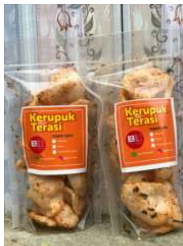
Gambar 3. Tampilan Baru Kerupuk Terasi L3

Fungsi terpenting dalam kemasan ialah untuk melindungi produk supaya tidak mudah rusak dan melindungi dari perubahan iklim yang berubah-ubah. Selain itu kemasan menjadi faktor yang cukup penting sebagai alat pemasaran atau marketing karena mampu menarik minat konsumen. Hal ini terlihat pada gambar 3. IKM ingin merubah kemasan yang lama karena biaya yang dikeluarkan kemasan lama lebih mahal, dan kami menawarkan untuk menggunakan kemasan yang lebih efisien dan harga penjualan produk kerupuk terasi pun dapat dijangkau oleh konsumen, sehingga menarik daya tarik pembeli karena harga yang lebih variatif