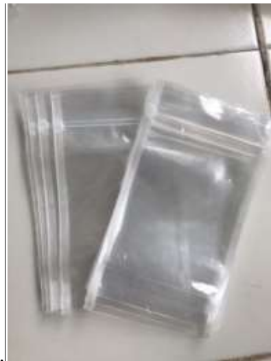
Gambar 2. Kemasan Kerupuk Terasi L3

Fungsi terpenting dalam kemasan ialah untuk melindungi produk supaya tidak mudah rusak dan melindungi dari perubahan iklim yang berubah-ubah. Selain itu kemasan menjadi faktor yang cukup penting sebagai alat pemasaran atau marketing karena mampu menarik minat konsumen. IKM ingin merubah kemasan yang lama karena biaya yang dikeluarkan kemasan lama lebih mahal, dan kami menawarkan untuk menggunakan kemasan yang lebih efisien dan harga penjualan produk kerupuk terasi pun dapat dijangkau oleh konsumen, sehingga menarik daya tarik pembeli karena harga yang lebih variatif